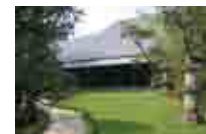
根津美術館(東京・青山)