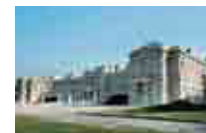
迎賓館(東京・赤坂)

新しい企画についての提案があり、詳細を検討して、総会で上程できる具体案を作成する。