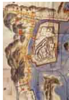
浅野文庫所蔵 諸国当城之図

鳥羽城については、かつてのその本来の姿がなかなか確認できなかったが、平成25年(2013年)に、鳥羽市立図書館に、天守の具体的な寸法などが記された古文書が発見された。それによると、天守閣は三層で一層目、二層目は正面約9メートル、奥行き約11メートルで、三層目が正面、奥行きともほぼ6メートルであった。