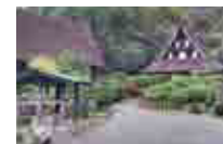
日本民家園(神奈川県・川崎市)