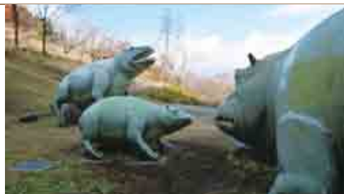
小鹿野町般若の丘にあるパレオパラドキシア親子像

上貴重な露頭だ。パレオパラドキシアは40年ほど前に化石が発見され日本と北米西海岸の海辺に生息した哺乳類だ。カバやセイウチに似た図体で海辺に生息する草食動物と考えられる。謎の部分も少なくない珍獣でパレオ(太古)のパラドキシル(逆説的)から連想した命名という。秩父・長瀬町にある埼玉県立自然の博物館はパレオパラドキシアの全身復元骨格や化石群を所蔵し大地の成り立ちを紹介する。地層から列島形成の地殻変動の様子を想像し、クジラやサメ、カニ、貝類など多くの化石とともに生物や環境をうかがい知る展示も興味深い。