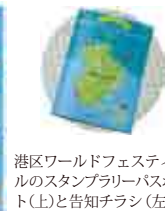
港区ワールドフェスティバルのスタンプラリーパスポート(上)と告知チラシ(左)

そもそものきっかけは、東京都の「地域資源発掘型実証プログラム事業」への参加を検討することから始まった。東京タワーや増上寺など都内屈指の観光資源を持つ港区である。埋もれている資源が何かあるか、港区ならではの長を活かす取り組みは出来るのか?と考えた。港区には総人口の7.7%に当たる約19,000人、120以上の国籍の外国人が住み、国内に立地している153カ国の大使館のうちの半分以上の81の大使館がある。この特色を活かし、大使館や商店街等の協力を得て「港区大使館周遊スタンプラリー」「港区商店街ワールドカードラリー」等のイベントからなる「港区ワールドフェスティバル」を開催することにした。港区内に立地する魅力的な地域資源である大使館や各団体との協働により、国際理解と交流を深めるとともに、様々な国の文化に触